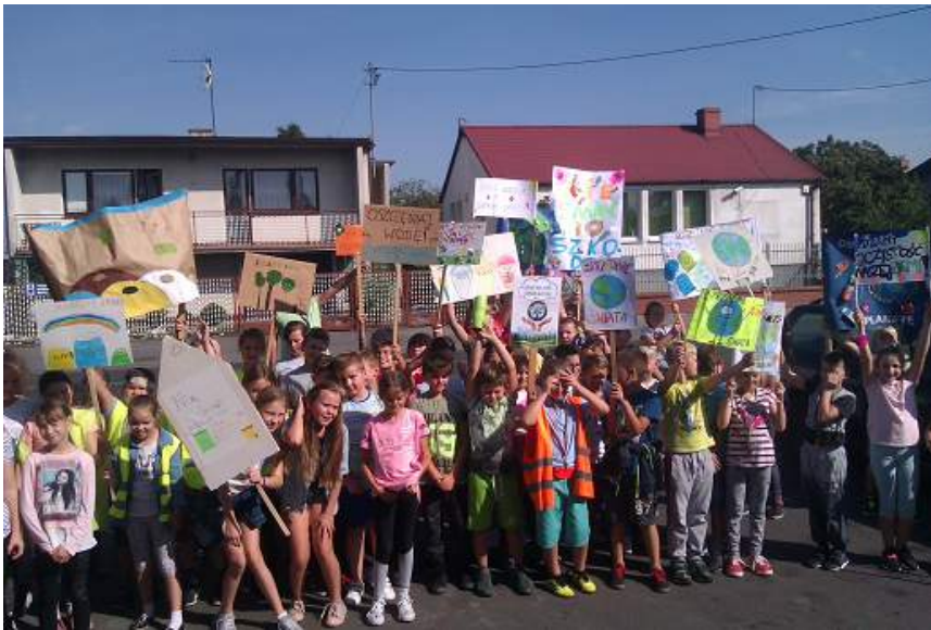
Propaganda ekologiczna w Turznie w Dniu Sprzątania Świata

Jak zwykle, sprzątający wyposażeni zostali w rękawiczki, worki oraz byli odpowiednio przeszkoleni i pod opieką nauczycieli.