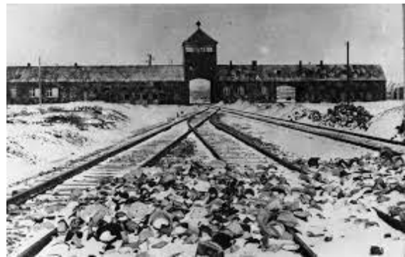
27 stycznia - Międzynarodowy Dzień Pamięci o Ofiarach Holokaustu