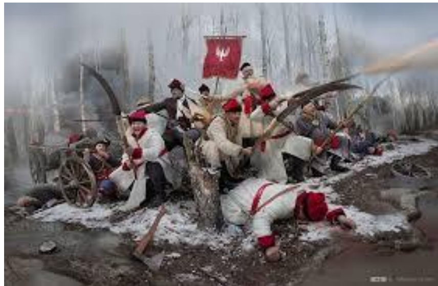
22 stycznia – 160. Rocznicą wybuchu powstania styczniowego