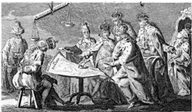
23 stycznia – 230. Rocznicą II rozbioru Polski